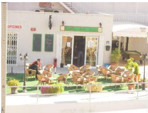
actividades nas proximidades