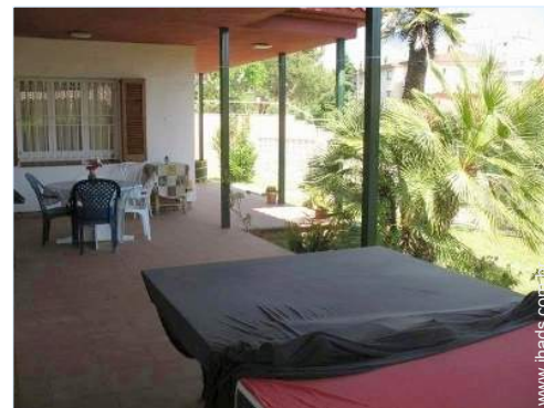
cadeira(s) de jardim