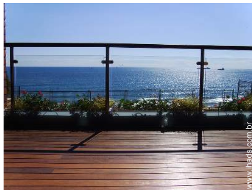
vista a partir do salão