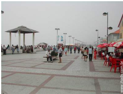
centro da cidade