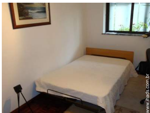
cama(s) convertível/eis dupla(s)