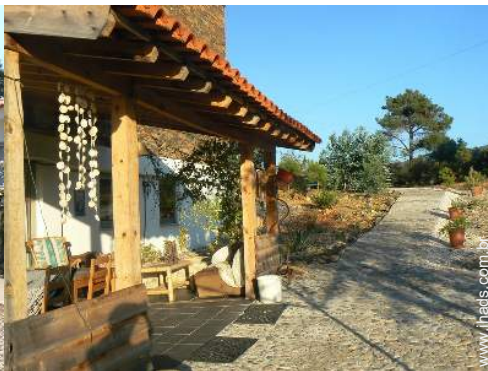
Equipamentos de lazer