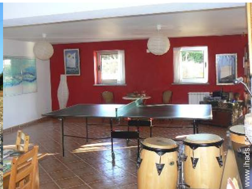
Equipamentos de lazer