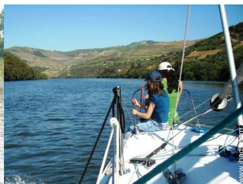
excursão de barco