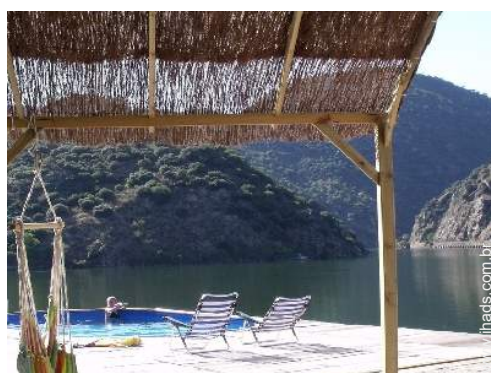
vista a partir do terraço