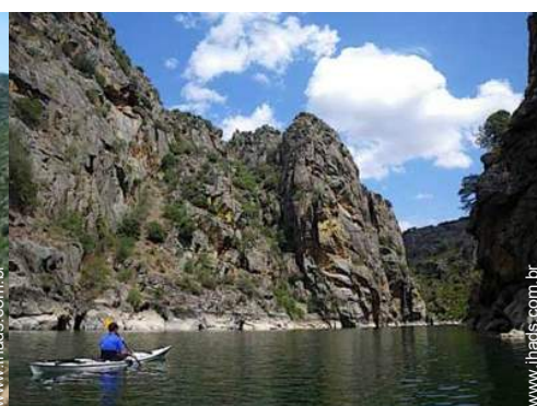
barco a remos