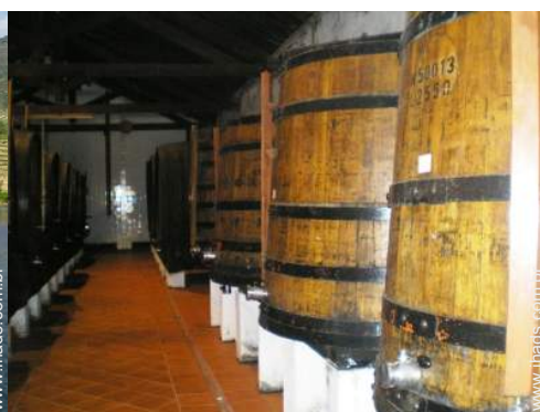
caves e provas de vinho