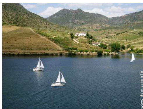
aluguer de barco