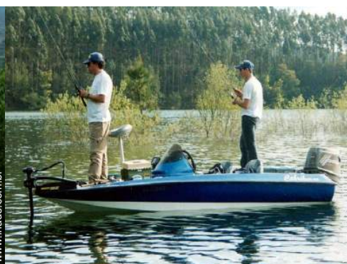
pesca à linha