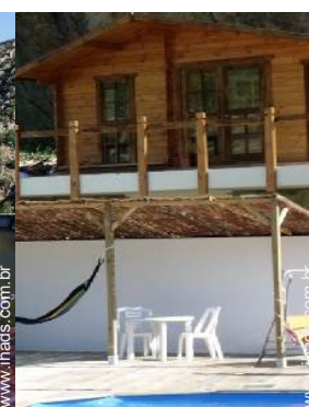
mesa(s) de jardim