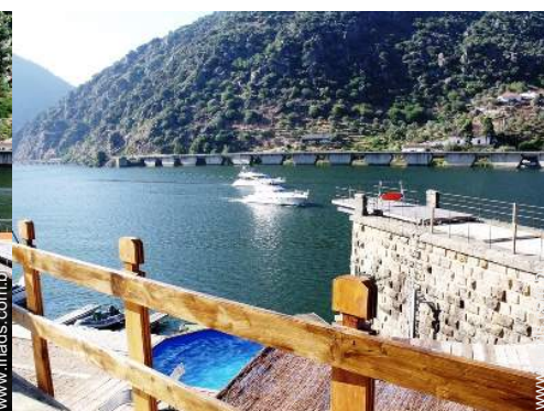
vista a partir da casa