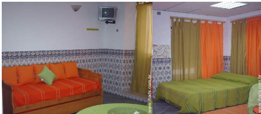
cama de gaveta 1 pessoa