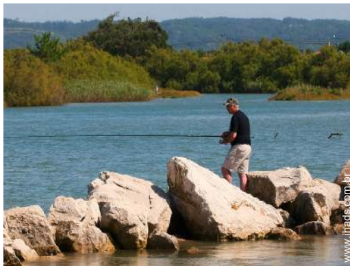
pesca à linha