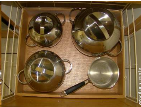
utensílios e trem de cozinha