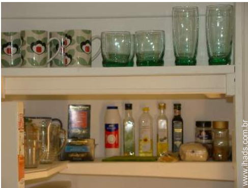
utensílios e trem de cozinha