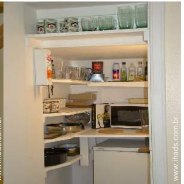
utensílios e trem de cozinha