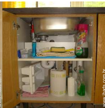
utensílios e trem de cozinha