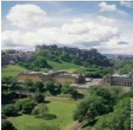
vista centro da cidade