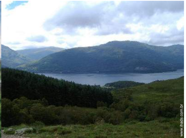
actividades de montanha nas proximidades