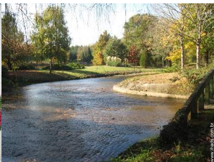
vista para rio