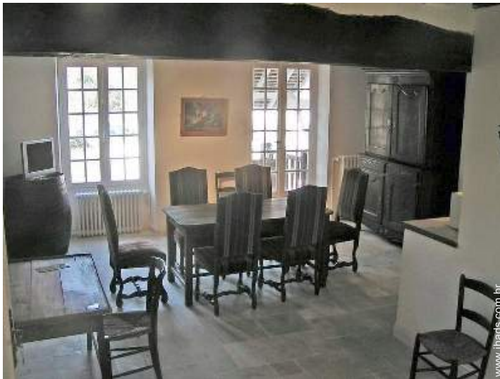
Antigo moinho de Encanto