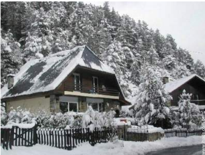
Chalé de Montanha