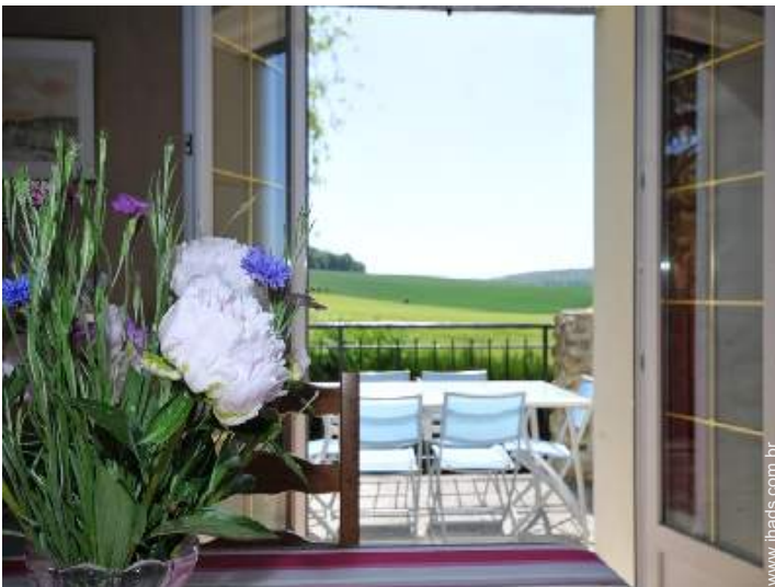
vista a partir da sala de jantar