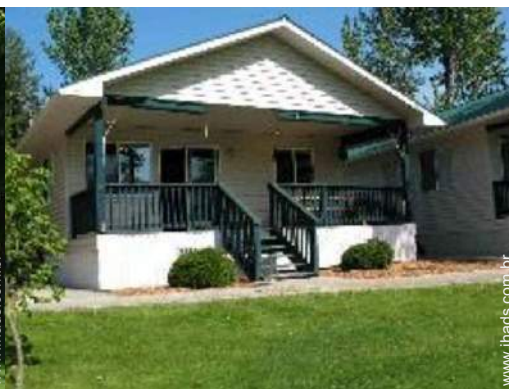
Casinha de campo