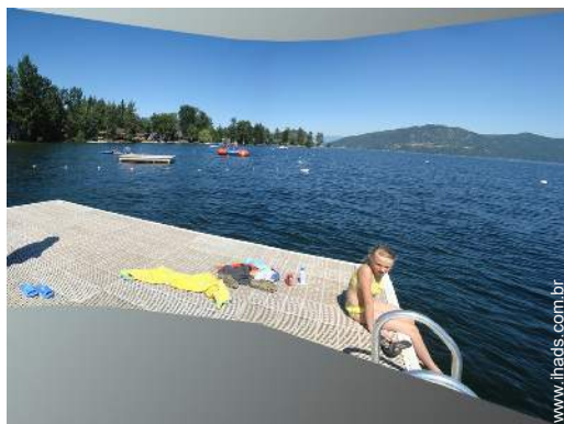
vista para lago