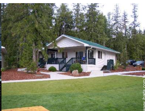
Casinha de campo