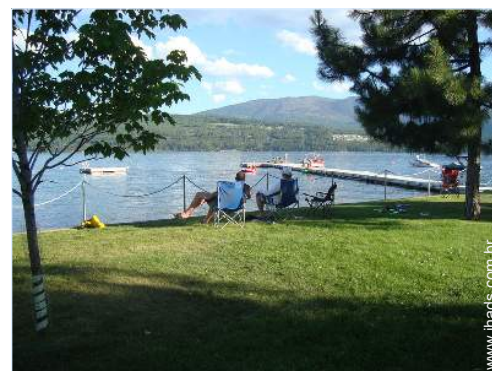
salão de jardim