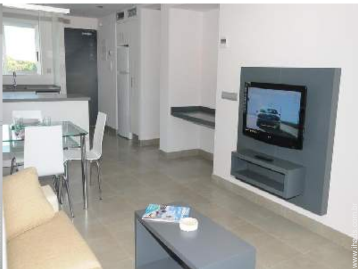
Conforto interior e equipamentos