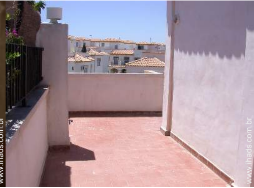
terraço no telhado