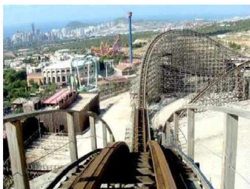
parque de lazer