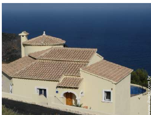
vista de mar