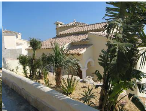
Ambiente exterior à disposição dos hóspedes