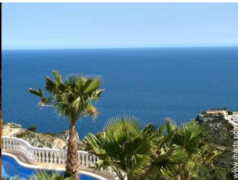
vista a partir do terraço