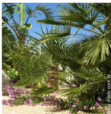
Ambiente exterior à disposição dos hóspedes