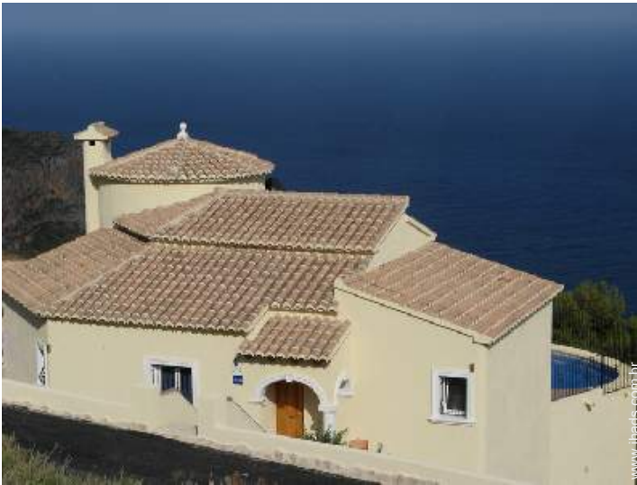
vista de mar