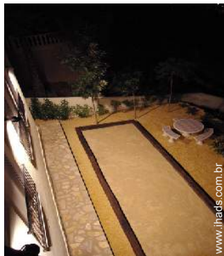
terreno de petanca