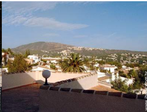
vista a partir do terraço sobre telhado