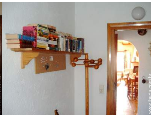
colecção de livros