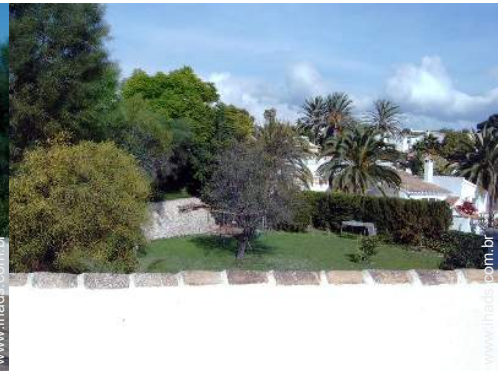
vista a partir do terraço sobre telhado