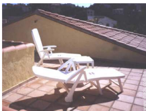
vista a partir do terraço sobre telhado