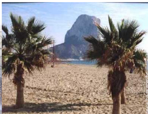
atividades balneares nas proximidades