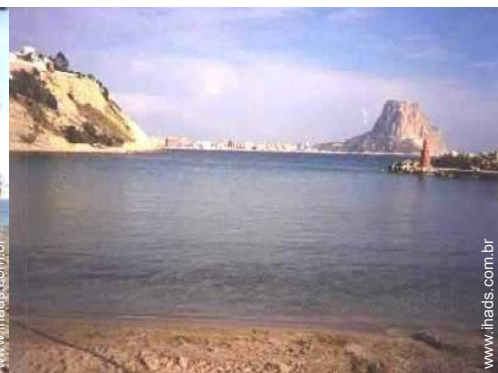
atividades balneares nas proximidades