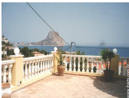
vista de mar