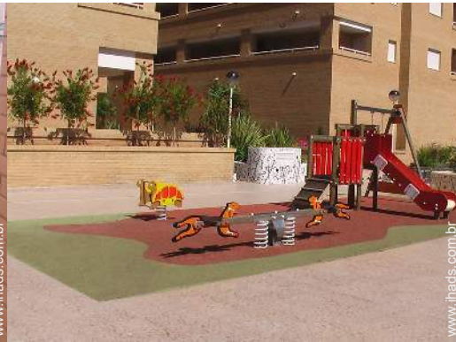
parque de bebé