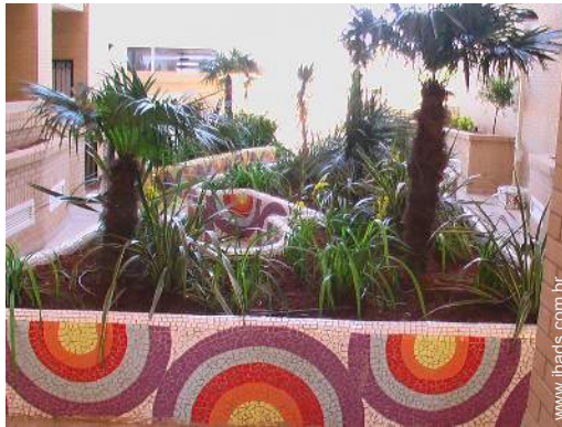
salão de jardim