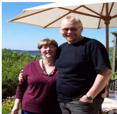
Os seus hóspedes