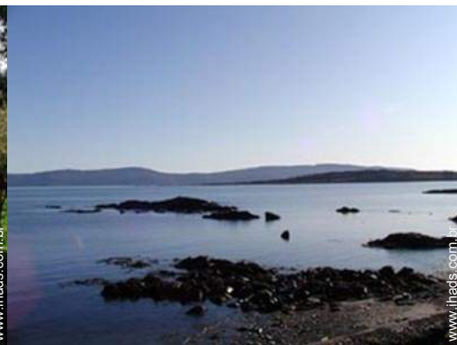
praia de seixos