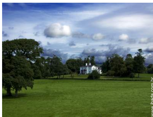
vista para pradaria