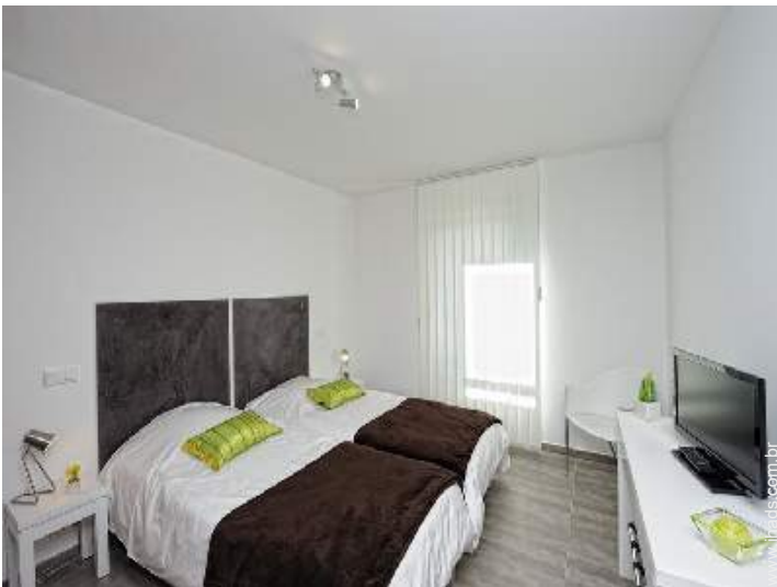
camas separadas simples