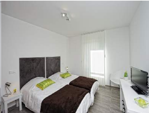
camas separadas simples