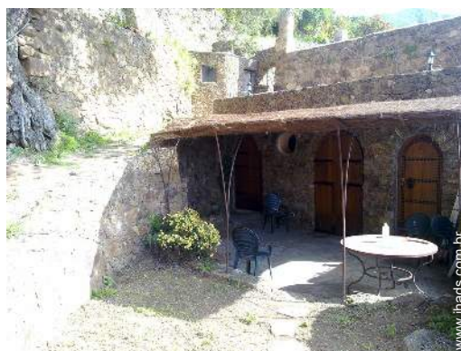
Casa de pedra