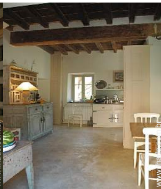
vista a partir da sala de jantar