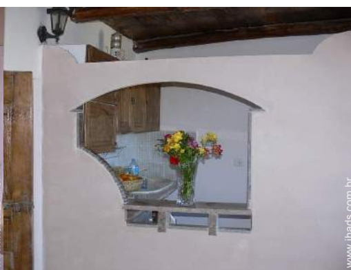
grande cozinha americana