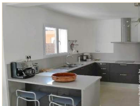
grande cozinha americana