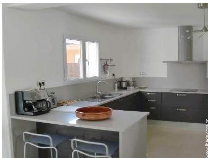
grande cozinha americana