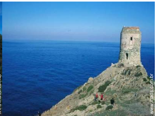
BTT (itinerário circuito)