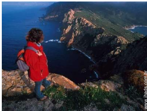
atividades de montanha nas proximidades