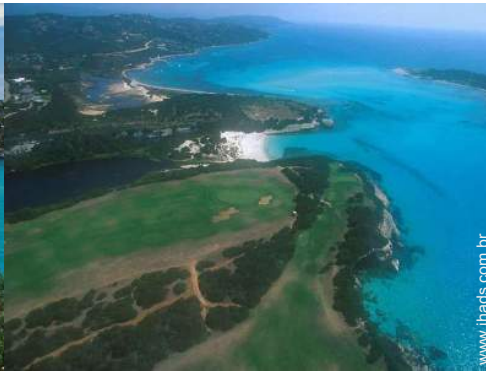
campo de golfe 18 buracos