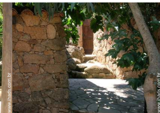
Casa de Encanto de pedra