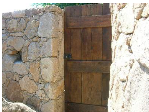
Propriedade de luxo