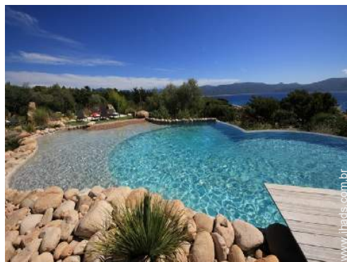
vista a partir da piscina