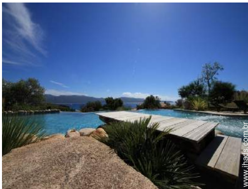
vista a partir da piscina