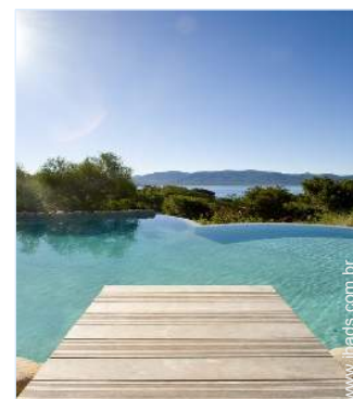
vista a partir da piscina