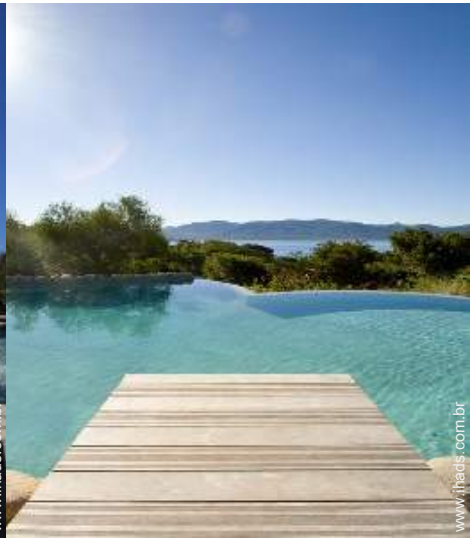
vista a partir da piscina