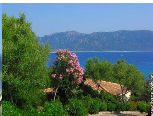
vista sobre o mar