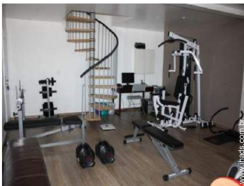
equipamento de musculação