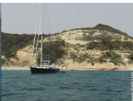
actividades náuticas nas proximidades