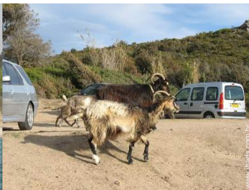
Presença no local