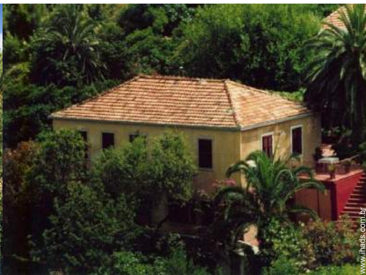
Casa de aldeia