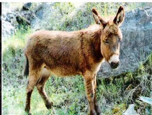
Os animais da casa