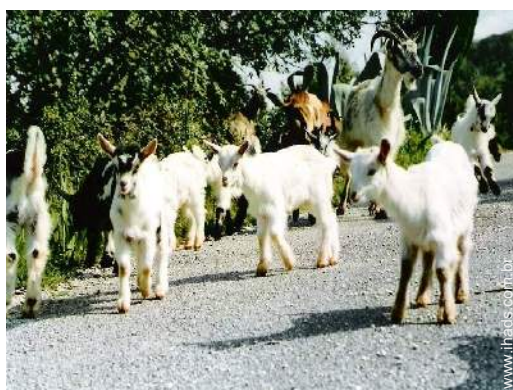
Os animais da casa