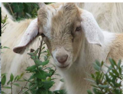
Os animais da casa