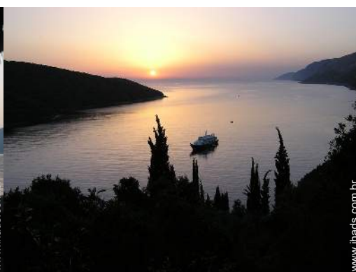
vista a partir da casa