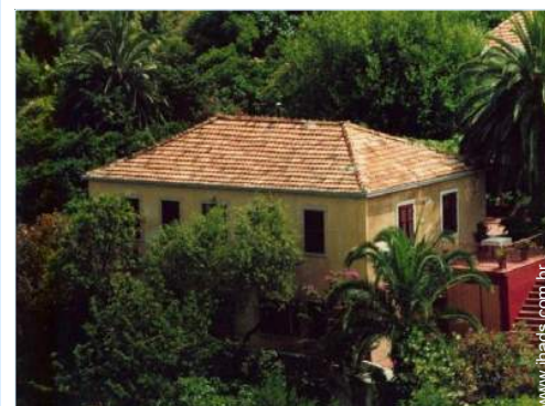
Casa de aldeia