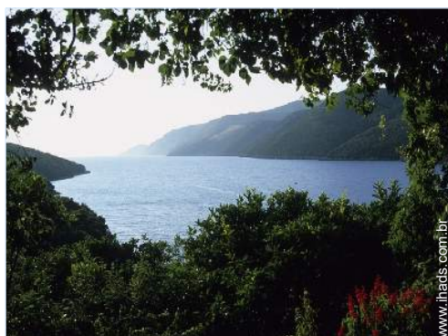
vista sobre o mar

Privilégios : Acesso directo à praia, praia privada, posto de amarração, practice, putting green, cavalaria (s)