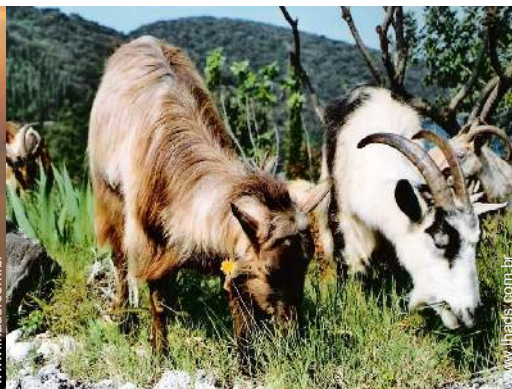
Os animais da casa