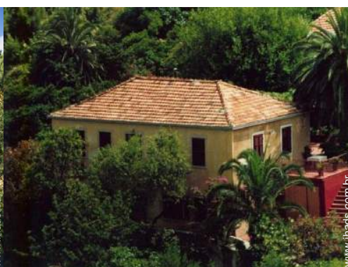
Casa de aldeia