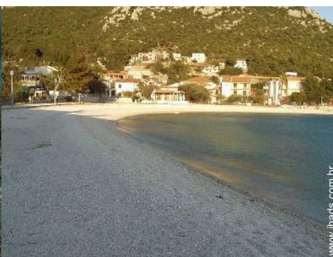
praia de seixos