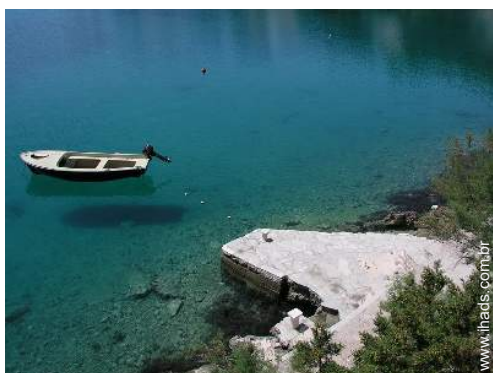
posto de amarração