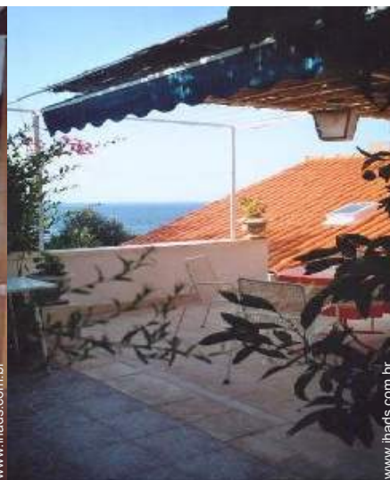
vista a partir do terraço