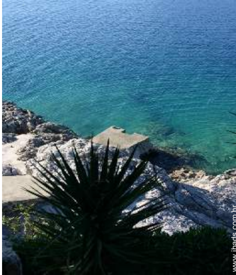
acesso directo à praia