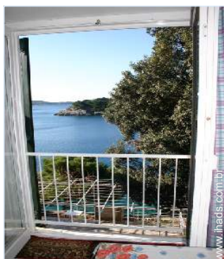
vista a partir da varanda

Privilégios : Acesso directo à praia, praia privada