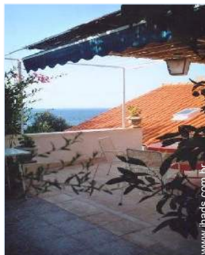
vista a partir do terraço