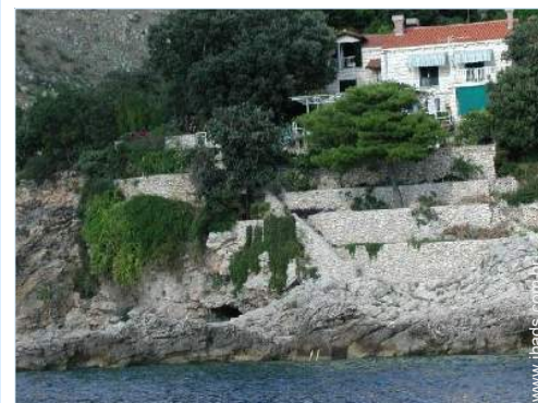
visão de conjunto