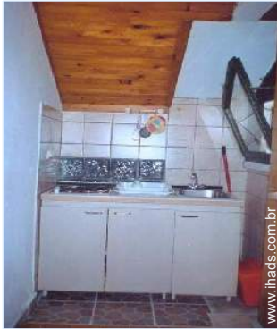
utensílios e trem de cozinha