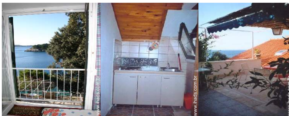
vista a partir da varanda