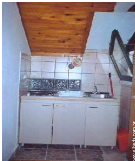
utensílios e trem de cozinha