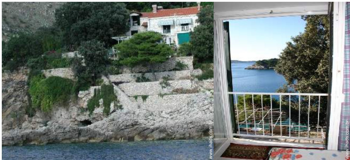
visão de conjunto