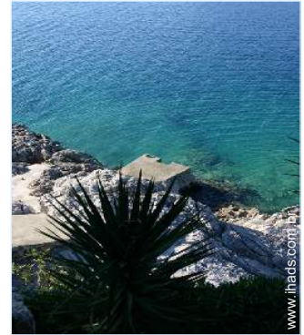
acesso directo à praia