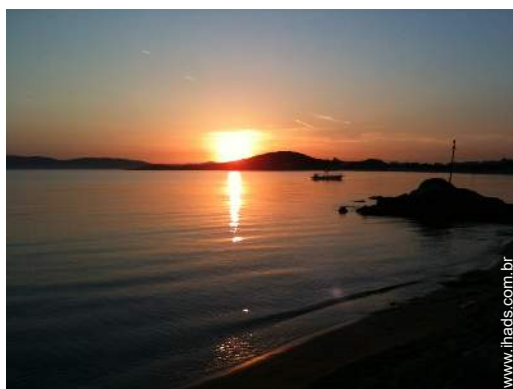
acesso directo à praia