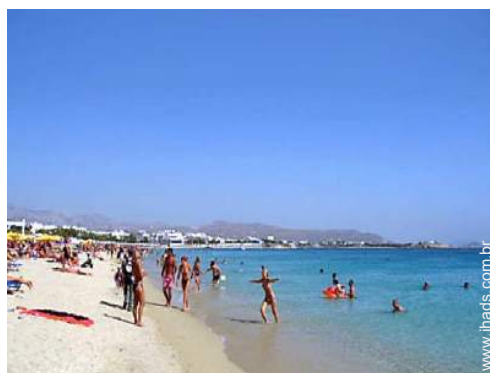
vista sobre o mar