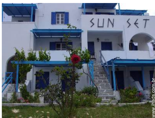
vista a partir da varanda