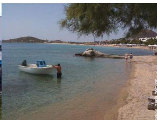
acesso directo à praia