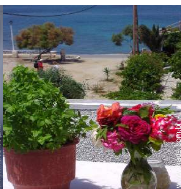
vista a partir da varanda