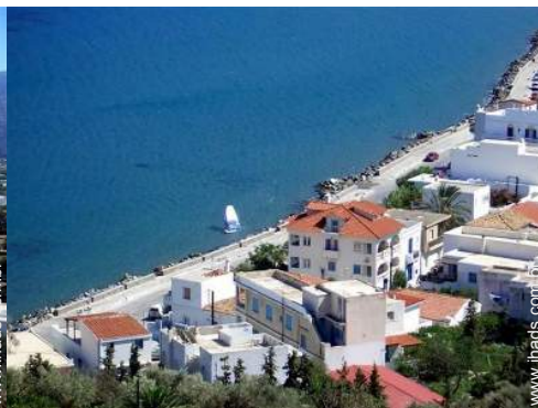
escola de vela