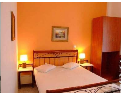
O quarto de hóspede