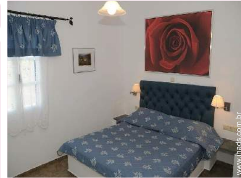
O quarto de hóspede