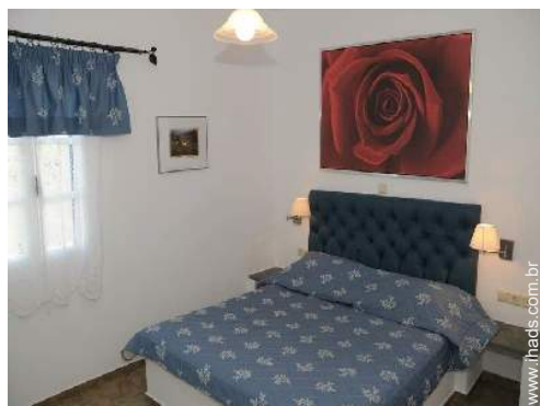
O quarto de hóspede