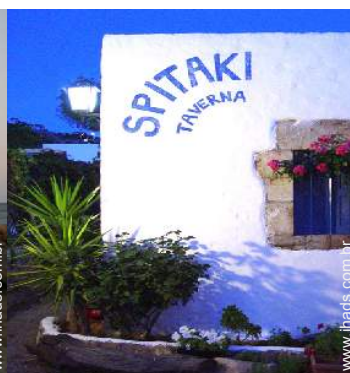
Instalações exteriores à disposição dos hóspedes