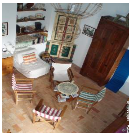
vista a partir da mezzanine