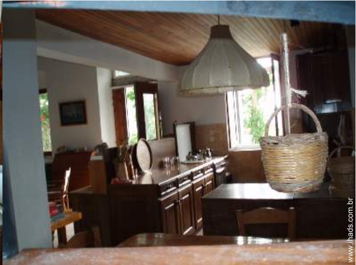
grande cozinha americana