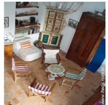
vista a partir da mezzanine