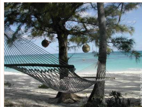
cama de rede