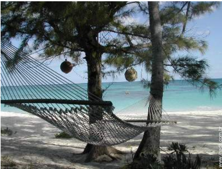
cama de rede