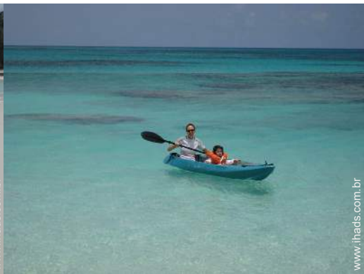
barco a remos