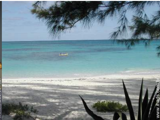
atividades náuticas nas proximidades