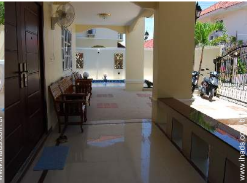
vista a partir do pátio