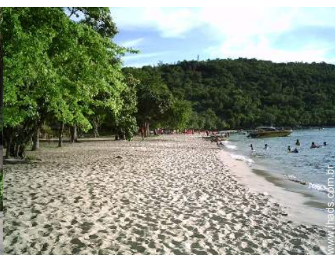
atividades balneares nas proximidades