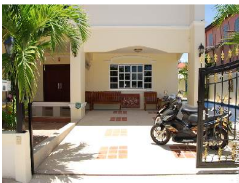
vista a partir do pátio