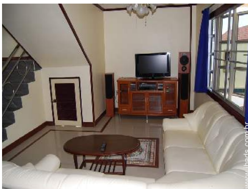
salão de música