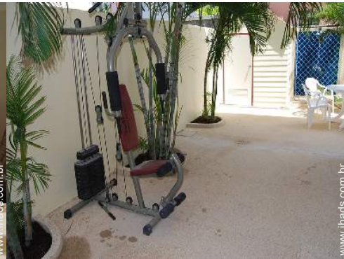
equipamento de musculação