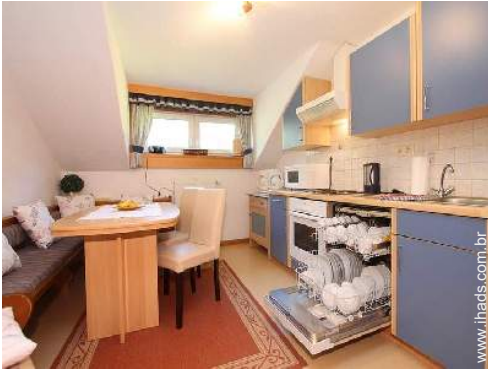
utensílios e trem de cozinha