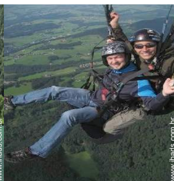
actividades de montanha nas proximidades