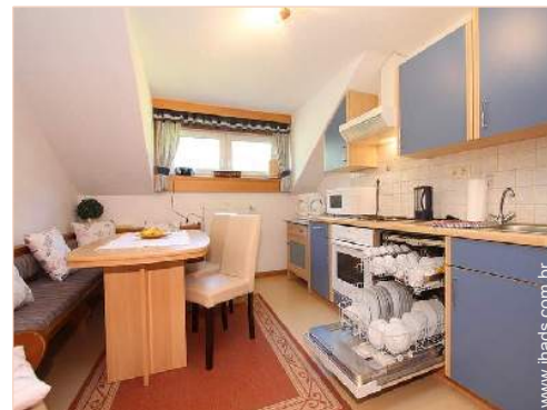
utensílios e trem de cozinha