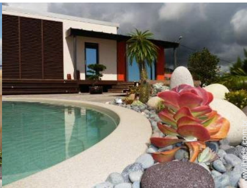
Estúdio de Encanto