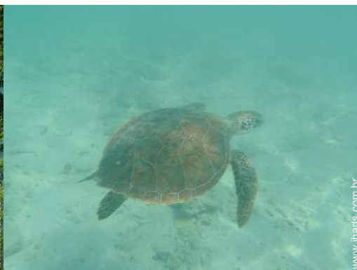
Presença no local