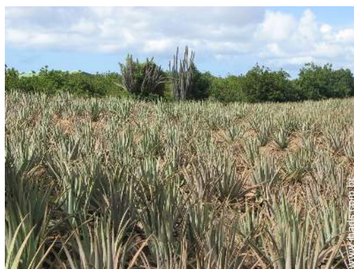
Atrações e lazer