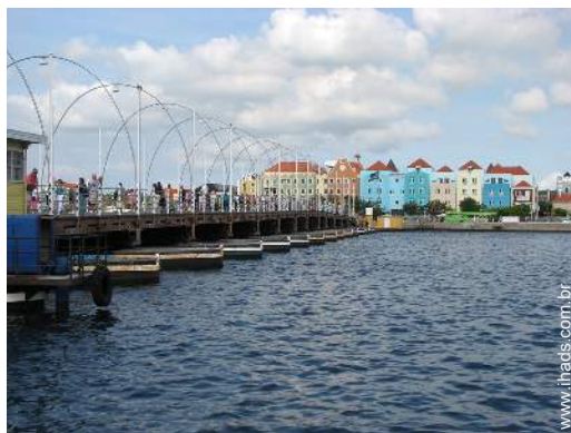
Atrações e lazer