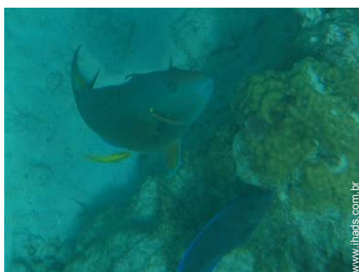
Presença no local