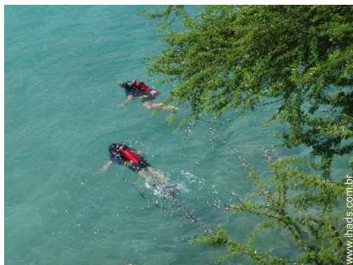
escola de mergulho