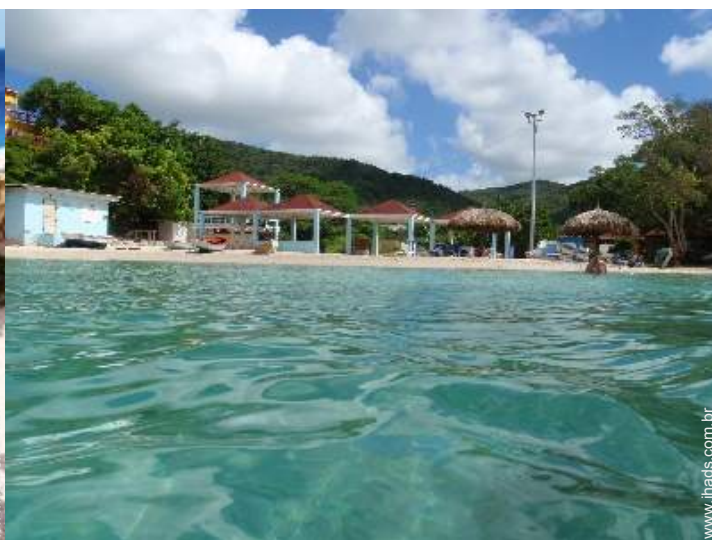
atividades nas proximidades