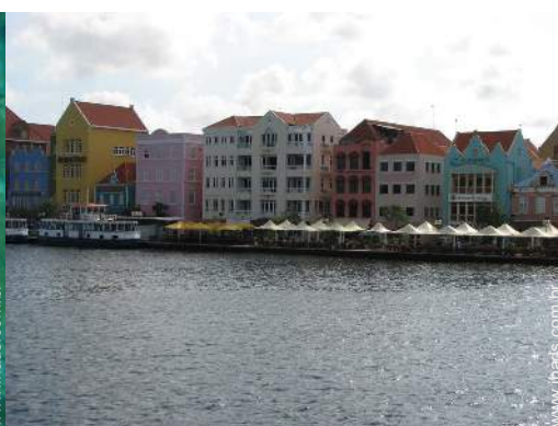
Cidades nas proximidades