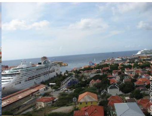
centro da cidade