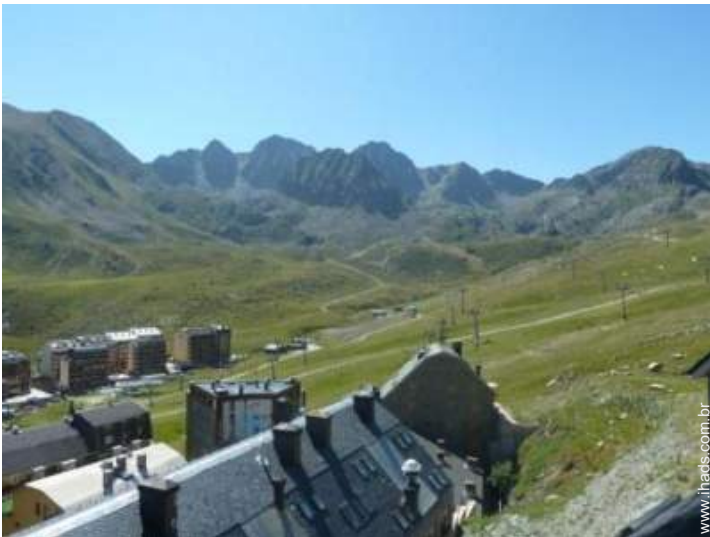
vista de serra