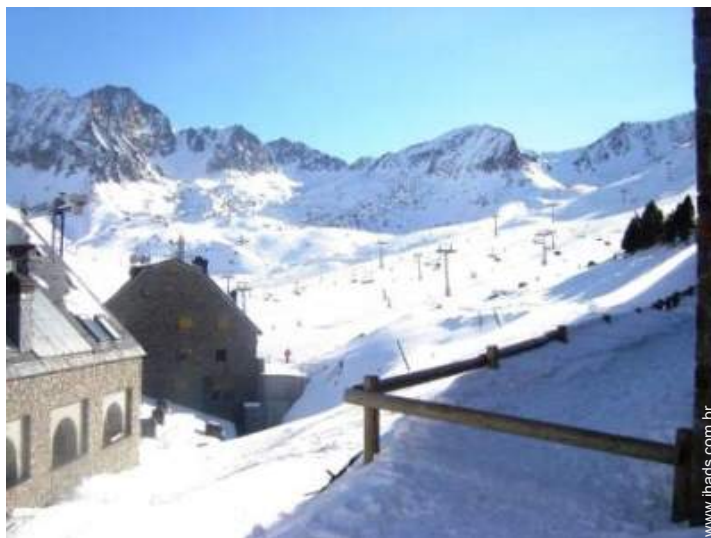
pistas de esqui