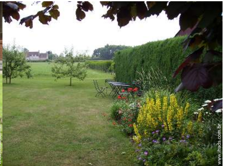
vista a partir da casa