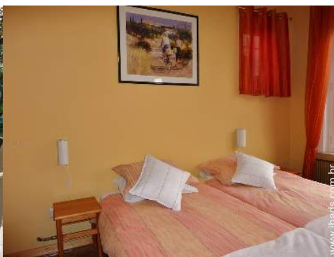
O quarto de hóspede