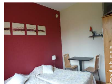
O quarto de hóspede