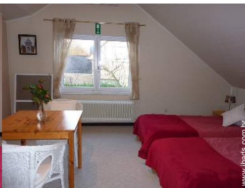
O quarto de hóspede