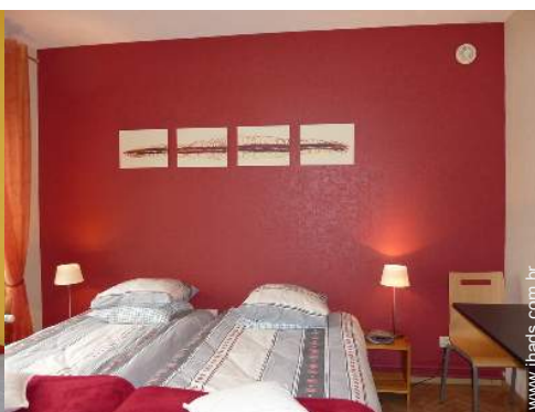
O quarto de hóspede