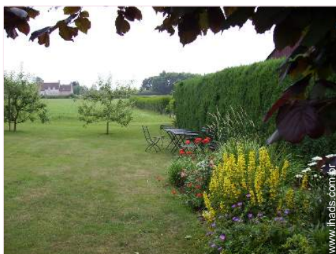
vista a partir da casa