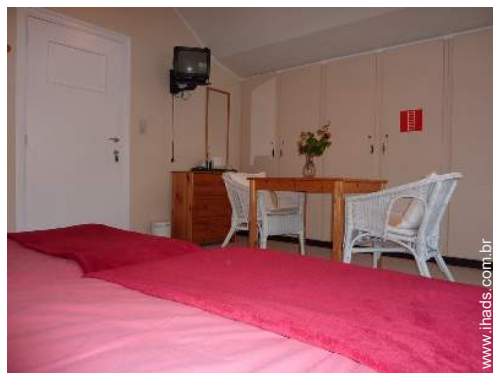
O quarto de hóspede