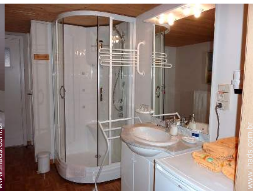
O quarto de hóspede